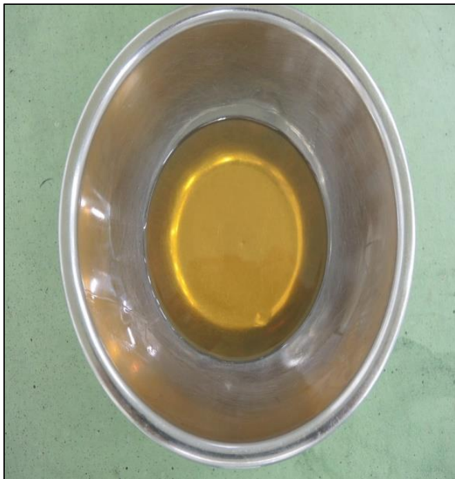
新品のギヤオイル