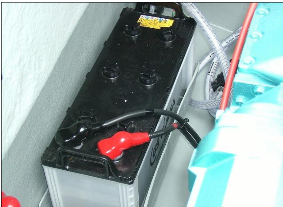
新品のバッテリー