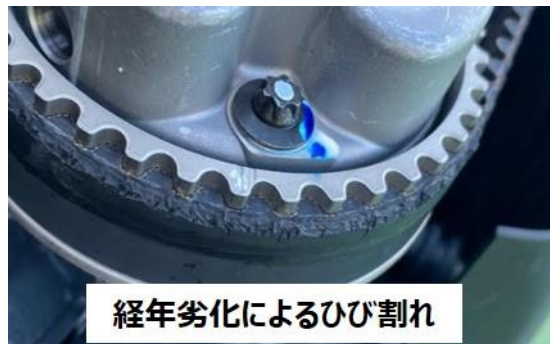
経年劣化によるひび割れ