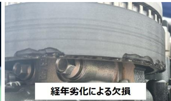
経年劣化による欠損