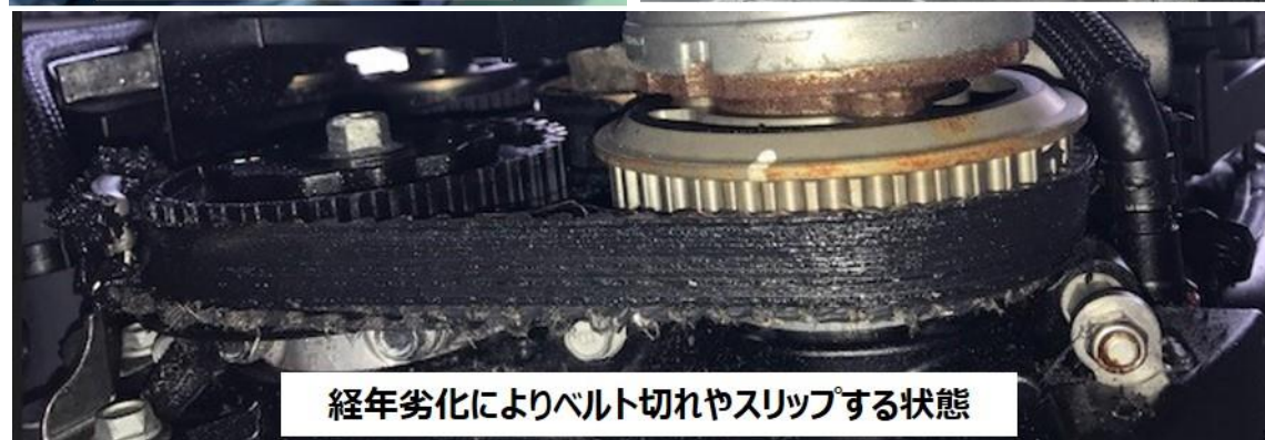
経年劣化によりベルト切れやスリップする状態